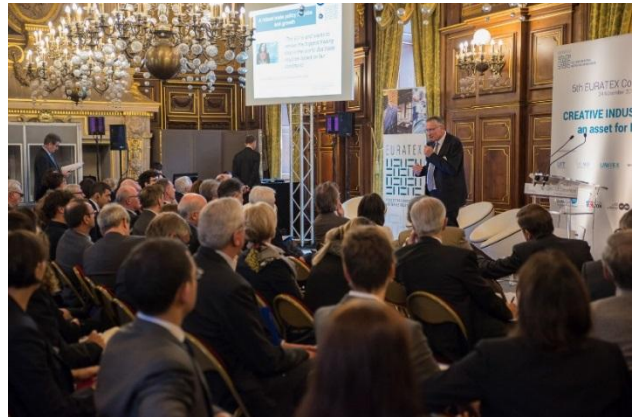
Serge Piolat, Président d'EURATEX ouvrant la Convention

Elle a été dédiée au rôle de l'Europe au service des industries créatives avec plus de 110 participants qui sont venus écouter 4 tables rondes, apportant des idées et des visions sur la manière dont les industries créatives du textile et de l'habillement affrontaient les défis pour maintenir et renforcer leur créativité.